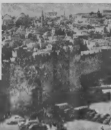
S.S. Papa Pablo VI dia 4 pa 6 di e luna aki a haci un bisbita historico na e Tera Santo. E foto aki ta muestra Su Santidad y un lista di e ciudad Jerusalem.